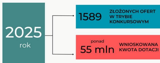
Wykres 3: Oferty złożone w trybie konkursowym

Konkursy ogłaszane były zgodnie z założeniami Programu oraz przyjętym Harmonogramem na 2025 rok.