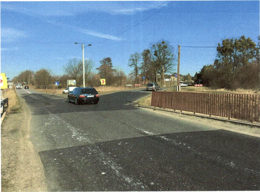
Skrzyżowanie drogi wojewódzkiej nr 487 z drogą powiatową 1312 w miejscowości Boroszów