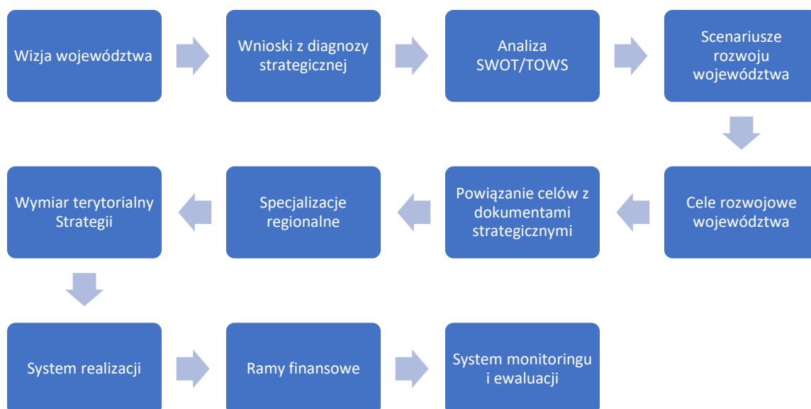
Diagram 3: Struktura projektu Strategii Rozwoju Województwa Opolskiego Opolskie 2030

Przyjęty układ dokumentu został odzwierciedlony na poniższym diagramie.