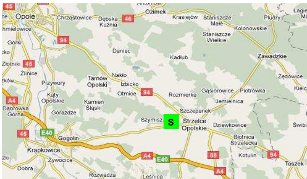
Rysunek nr 2. Mapa lokalizacyjna składowiska odpadów