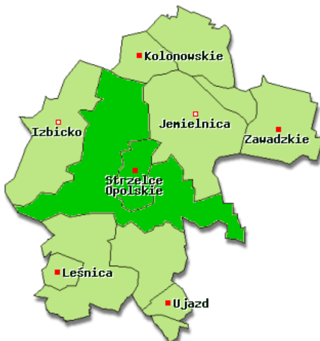
Rysunek nr 1. Położenie Gminy Strzelce Opolskie

W opracowaniu wykorzystano mapy cyfrowe IMAGIS (R)