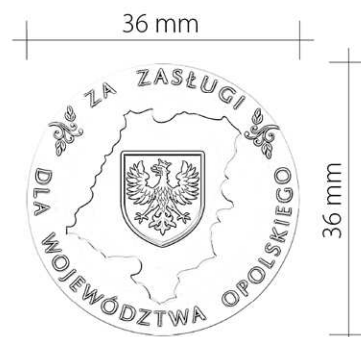
Wersja linearna skala 1:1

Odznaka Honorowa "ZA ZASŁUGI DLA WOJEWÓDZTWA OPOLSKIEGO", ma kształt okręgu o średnicy 36 mm. Odznaka wykonana jest z metalu w kolorze patynowanego miedzi. W środkowym awersie odznaki na niebieskim polu widnieje złoty herb województwa opolskiego. Herb leży na uproszczonym konturze województwa opolskiego. Herb otoczony jest napisem "ZA ZASŁUGI DLA WOJEWÓDZTWA OPOLSKIEGO", krój liter występujący w znaku to font zapfHumanist610pl demi (Księga SIW - Herb Województwa Opolskiego - Typografia). Po prawej i lewej stronie górnej części odznaki znajdują się ornamenty kwiatowe uwzględniające zasady nowej strategii Marketingowej Województwa Opolskiego. Odwrotna strona odznaki ma gładką powierzchnię.