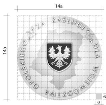
Wersja czarno-biała skala 1:1 Konstrukcja symbolu -modułem konstrukcyjnym symbolu jest kwadrat o boku „a”.